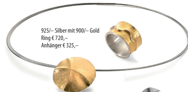
925/- Silber mit 900/- Gold Ring € 720,- Anhänger € 325,-

Handwerkliche Freiheit und Kreativität. Jedes Stück ist ein Unikat und die Form entsteht durch die Individualität des Materials und des Goldschmieds. Schmuckstücke für jemanden, der das Einzigartige liebt.