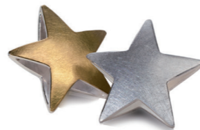
Anhänger Silber € 180,- Silber und 900/- Gold € 320,-

„Greife nach den Sternen, lebe jeden Moment!“ Motivation und Liebeserklärung zugleich – ein schönes Geschenk für alle Sternengucker und liebe Menschen, die noch träumen können