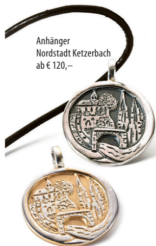
Anhänger Nordstadt Ketzertbach ab € 120,-