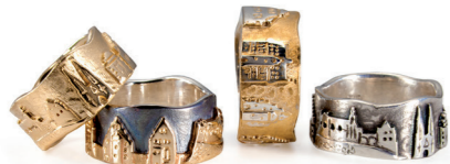
Ringe 925/- Silber ab € 150,-

Historische Stadtansichten mal ganz anders! Die bekanntesten Marburger Gebäude als Schmuckstück. Für Marburger, für Studierende und Ehemalige oder Freunde unserer schönen Stadt.