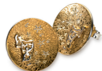
Ohrstecker teilvergoldet € 185,-

Bezaubernde Wesen aus den Märchen der Brüder Grimm beleben diese kleinen, feinen Stücke aus unserer Goldschmiede Werkstatt.