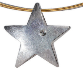
Anhänger mit Brillant ab € 245,-