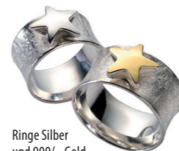
Ringe Silber und 900/- Gold ab € 275,-