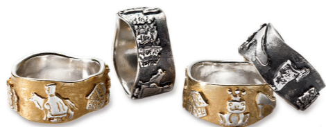
Ringe 925/- Silber ab € 150,-