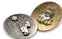
Anhänger klein ab € 90,-