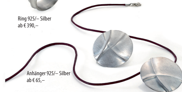
Anhänger 925/- Silber ab € 65,-