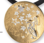
Anhänger groß ab € 130,-, vergoldet ab € 150,-