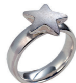
Ringe 925/- Silber ab € 190,-