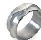
Ring 925/- Silber ab € 390,-