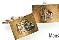
Manschettenknöpfe ab € 220,-